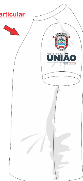
lado esquerdo (brasão do Município)

Quando for escola particular colocar a logo.